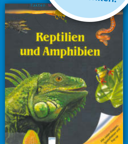
Fakten - Wissen - Abenteuer Kindersachbuch