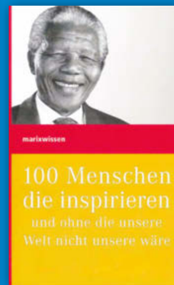
Persönlichkeiten der Geschichte Gebundene Ausgabe, 384 Seiten