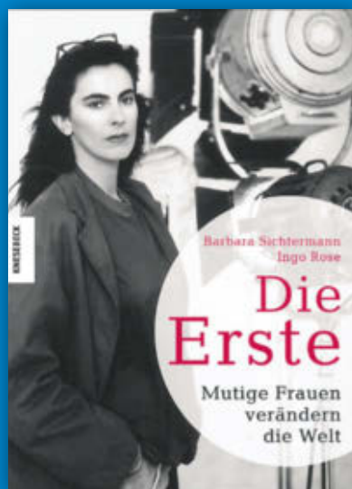
18 außergewöhnlichen Frauen 128 Seiten, mit ca. 80 Abbildungen